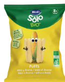
Puff mais e avena Bio 25 g € 1,35 €54,00 al kg