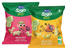
Mini Puff Bio vari gusti 18 g € 1,15 €63,89 al kg