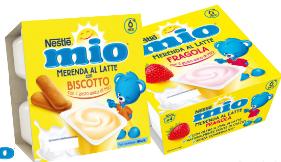
Nestlé mio Merenda al latte vari gusti 360 g (4x90 g)