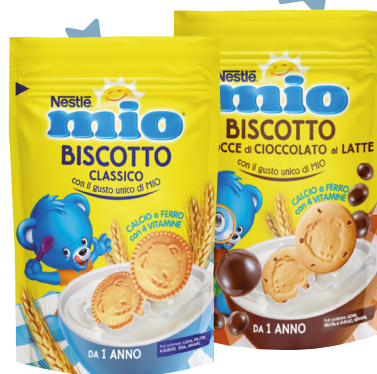
Nestlé mio Biscotti vari tipi 150 o 180 g