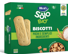
Biscotti Bio 320 g € 3,39 €10,59 al kg