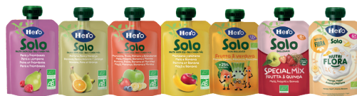
Merenda da spremere di frutta Bio vari gusti 100 g € 1,19 €11,90 al kg