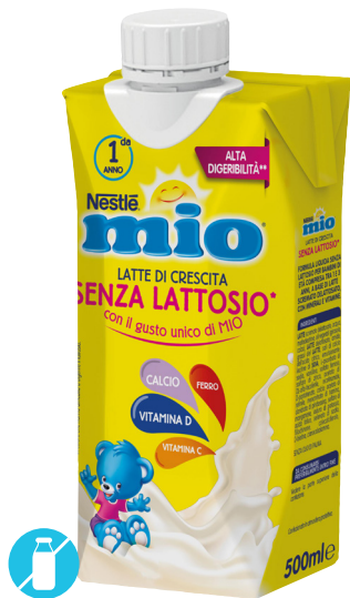
Nestlé mio Latte di crescita senza lattosio liquido 500 ml