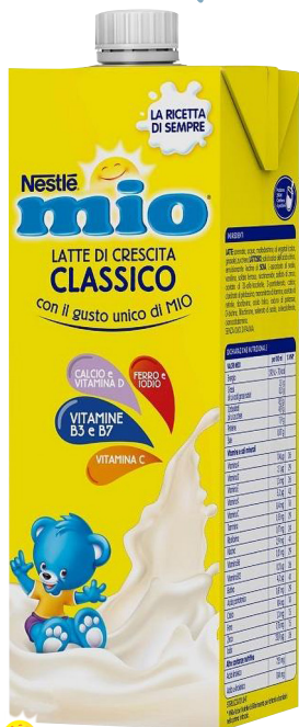
Nestlé mio Latte di crescita classico liquido 1000 ml