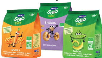
Snack Bio vari gusti 40 o 50 g € 1,89